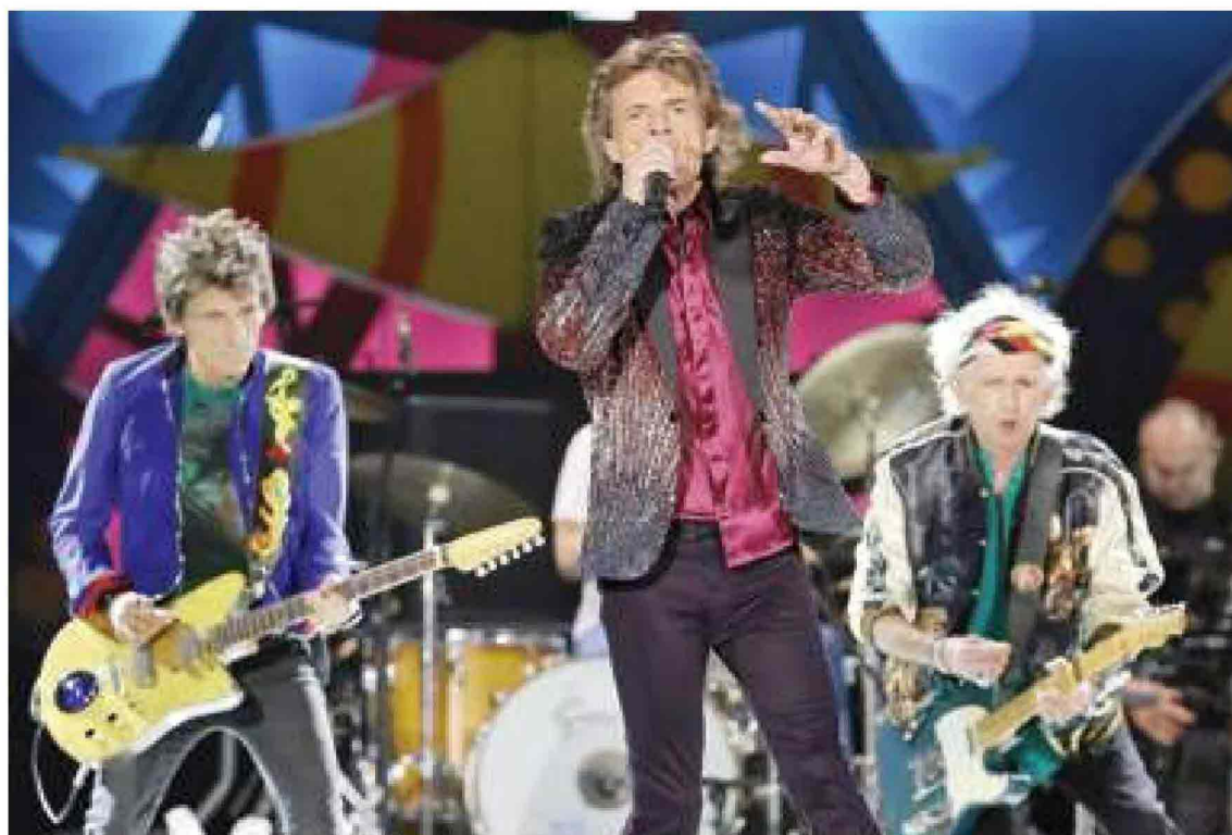
I Rolling Stones suoneranno sotto le mura, a Lucca, nell'ambito del Summer Festival